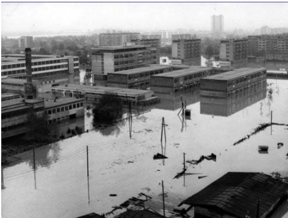
Katastrofalna poplava Save kod Zagreba, 26.10.1964., H=514 cm, Q=3126 m 3 /s