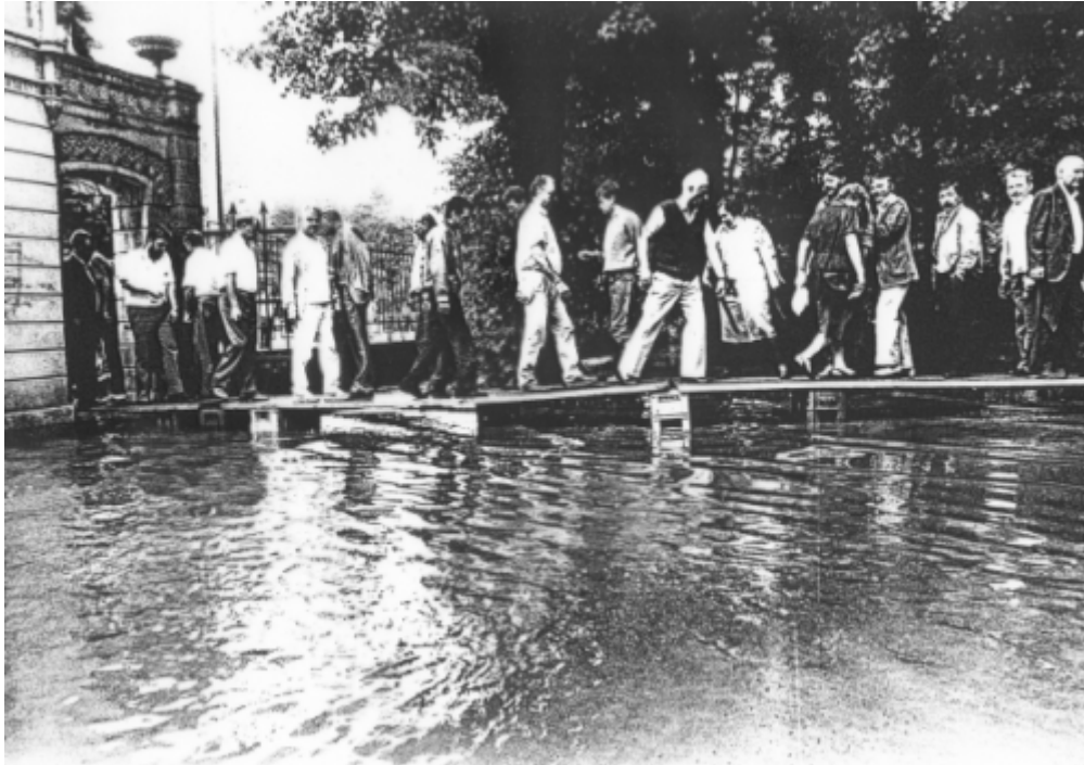
Poplava brdskih potoka Medvednice - potok Bliznec kod ulaza u park Maksimir, 05.07.1989.