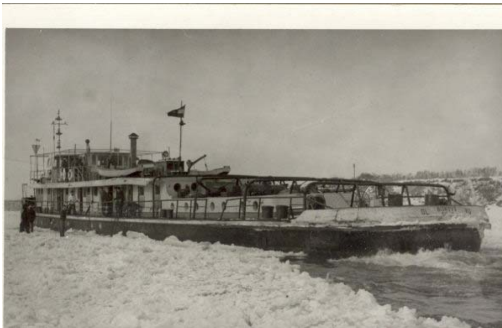
Brod Biokovo zarobljen u ledu, Sava kod Ruščice (Slavonski Brod), 17.01.1985. Debljina leda oko 30 cm, H=173 cm, Q=637 m 3 /s; najniža temperatura zraka -25,2 °C 12.01.1985.