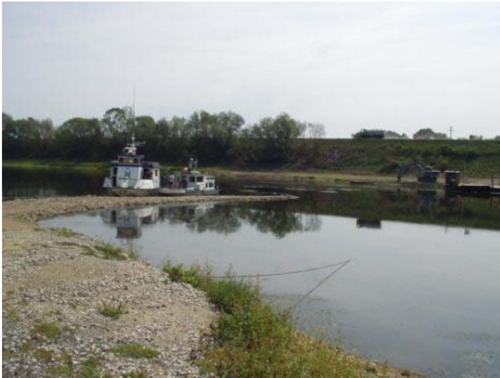
Skela Lukavec - Graduša Posavska na Savi kod Gušća, kolovoz 2003.