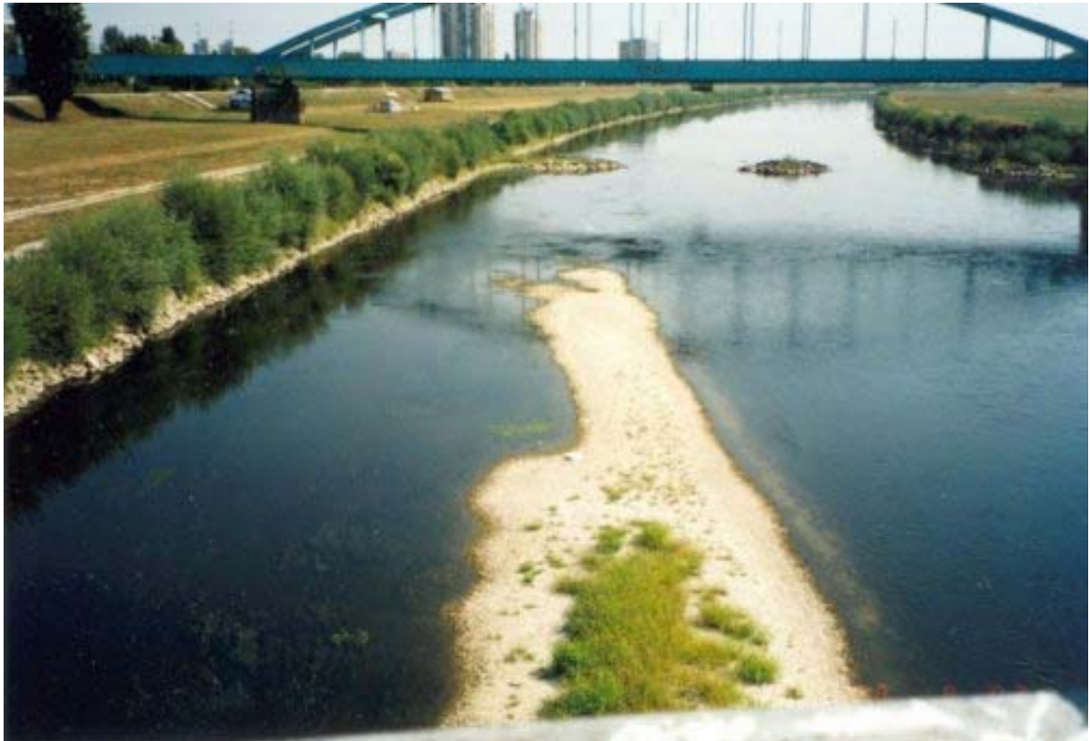
Male vode Save kod Zagreba, 28.08.2003., H=-305 cm, Q=64,0 m 3 /s

Kao što je rečeno, moto ovogodišnjeg Dana voda je: Voda i katastrofe - Budi informiran i budi spreman . Očigledno je da voda, kao ključna sirovina, koja je prostorno i vremenski vrlo nejednoliko raspoređena, sve više postaje čimbenik ograničavanja gospodarskog i društvenog razvitka pa prema tome i čimbenik politike. Potrebe za slatkom vodom se stalno povećavaju i zato vode treba kontinuirano procjenjivati i pažljivim gospodarenjem sačuvati. Samo zajedničke akcije na lokalnom, nacionalnom, regionalnom i globalnom nivou mogu osigurati održivi razvitak. Državni hidrometeorološki zavod više od 57 godina aktivno sudjeluje, a sudjelovat će i u budućnosti, u svim akcijama vezanim za vode kao što su: procjena vodnih resursa, prognoze i upozorenja, uključujući prognoze poplava i suša, te zaštita vodnih resursa.