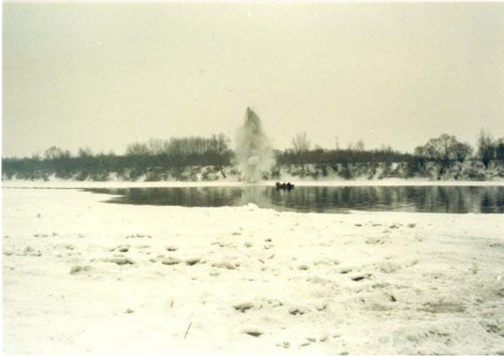
Razbijanje leda kod Ruščice (Slavonski Brod) da bi se izbjegla ledena poplava, 17.01.1985.