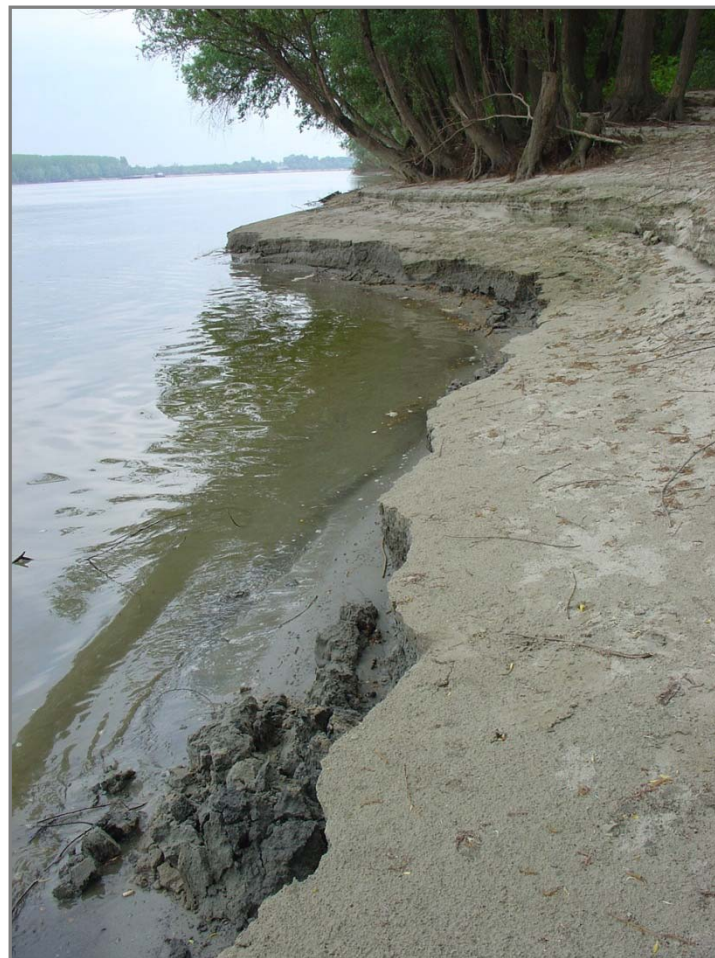
DUNAV – Vukovar (24.08.2002.)