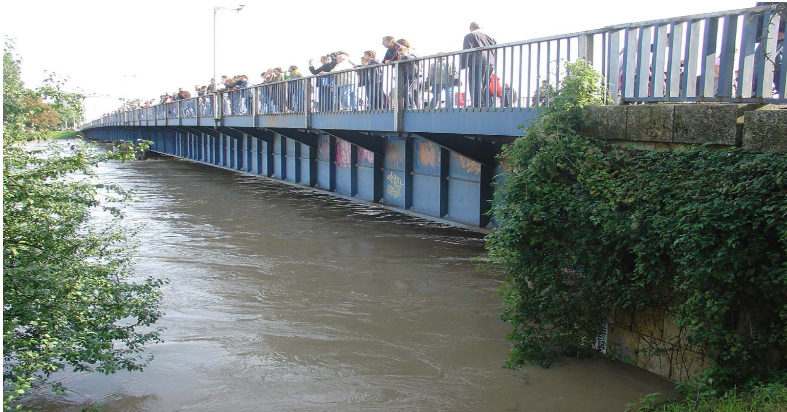
Sava – Zagreb (19.09.2010.)